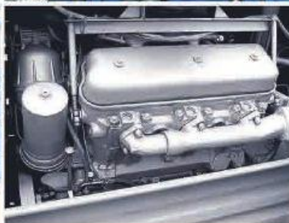
Двигатель ЯМЗ-236 Д, мощность 175 л. с.

Комфортабельная кабина с тепло-, шумоизоляцией и возможностью установки